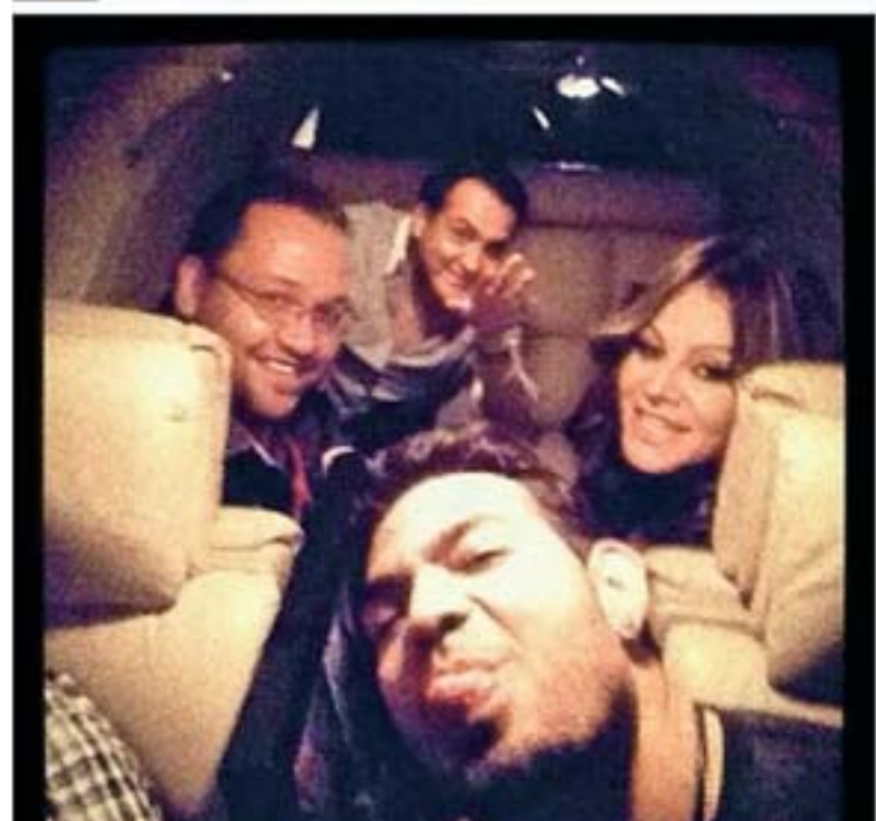
ÚLTIMA FOTO. Imagen publicada en Twitter por el maquillista de la cantante, luego de abordar el avión que los conduciría a Toluca

jacobyebale Aeropuerto Internacional de Monterrey... 9h