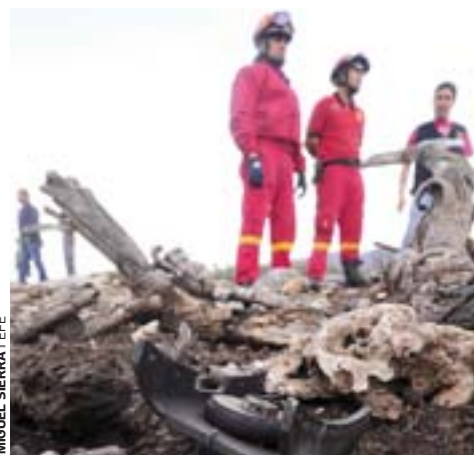
RESCATE. La búsqueda de cuerpos se suspendió por la noche. Peritos encontraron una identificación de Jenni Rivera

La cantante de música de banda murió ayer al desplomarse en Nuevo León la aeronave que la conducía de Monterrey a Toluca. Los restos no han sido recuperados, pero autoridades confirmaron que ningún ocupante sobrevivió.