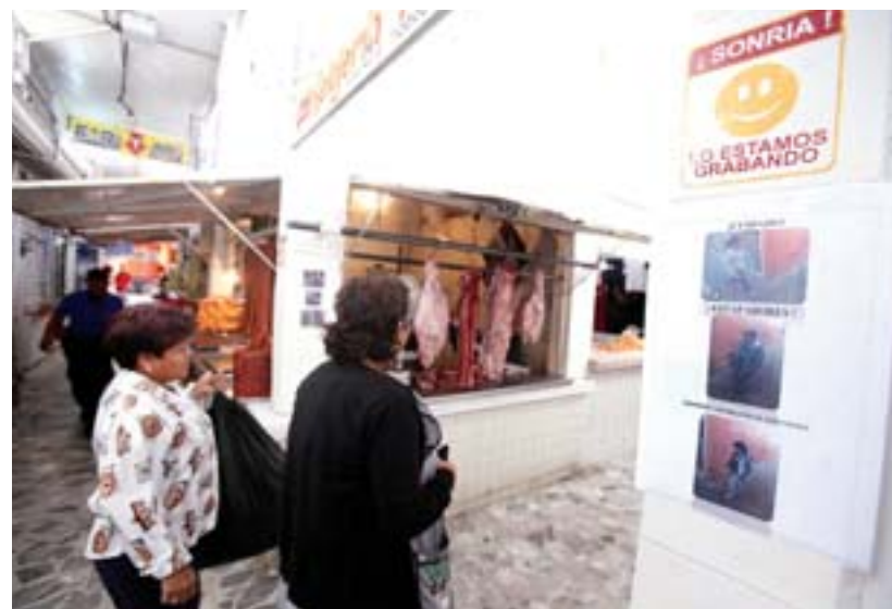
AMENAZA. Locatarios indican que la extorsión es el delito que más enfrentan