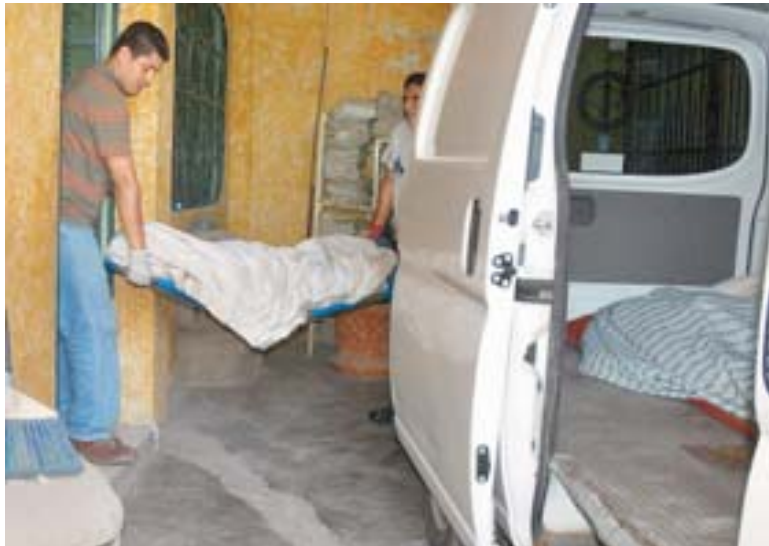
VIOLENCIA Un cuerpo es retirado de una estación policial en Acapulco, Guerrero, tras el ataque de ocho desconocidos