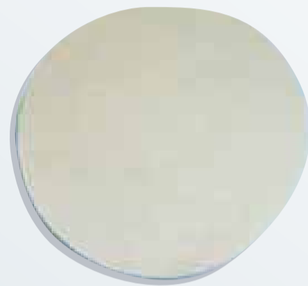
◀ Implante normal

Los implantes fueron fabricados con un gel de silicona no autorizado. Por eso recomiendan a las portadoras una mamografía, una tomografía axial computarizada o la resonancia magnética. para descartar que se hayan roto