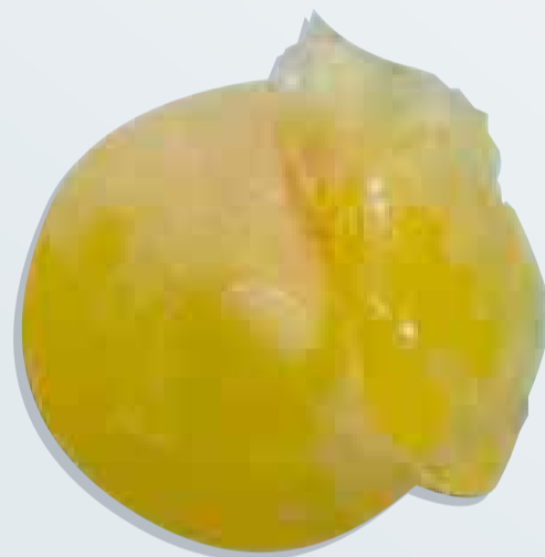
◀ Implante roto

La rotura de un implante puede ser intracapsular o extracapsular, lo cual producirá una liberación menor o mayor del contenido. Las extracapsulares tienen alto potencial de captación linfática de la silicona pudiendo derivar en granulomas y/o adenopatías axiliares o en el área torácico-mamaria. Según especialistas, 75% de las rupturas son intracapsulares y 25% extracapsulares