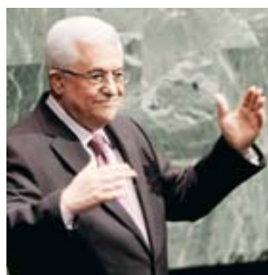
BENEPLÁCITO. Mahmud Abbas, líder de la Autoridad Palestina

El presidente del PAN, Gustavo Madero, mencionó que hay un consenso para empujar el acuerdo. NACIÓN A13