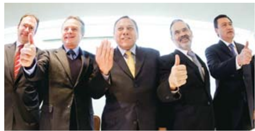
COMPROMISO. Luis Videgaray, Pedro Joaquín Coldwell, Jesús Zambrano, Gustavo Madero y Miguel Ángel Osorio Chong, durante la reunión

•• PAN y PRD en el Senado negaron al PRI la aprobación de la reforma a la Ley Orgánica de Administración Pública Federal que pidió el presidente electo Enrique Peña Nieto para configurar su gabinete, sin la SSP y la SFP NACIÓN A9