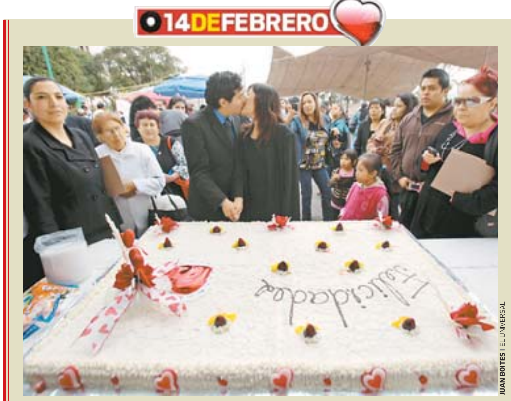
CEREMONIA MASIVA. En Magdalena Contreras 278 parejas contrajeron matrimonio