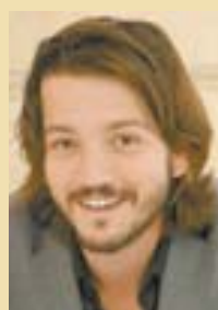
DIEGO LUNA PRD dice que lo quiere