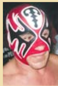
ATLANTIS Luchará por el PAN