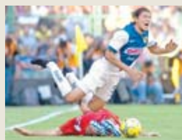
AMÉRICA igualó a 2 con el Toluca

AGUIRRE COSECHA EMPATE; HUGO SIGUE INVICTO D6