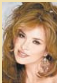
GLORIA TREVI El PSD la reclutó