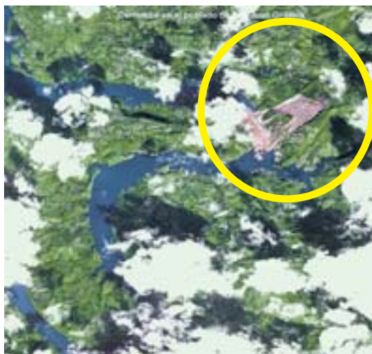
USO Derrumbe detectado en San Juan Grijalva