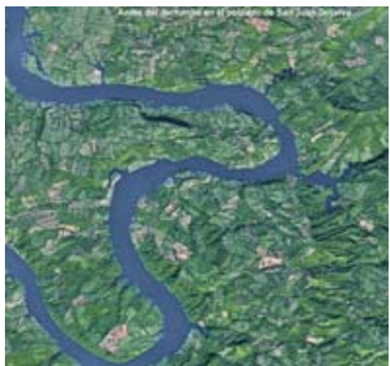
AYUDA Primero, los satélites apoyaron a la Sagarpa

El narco fondea bancos, afirma la oficina antidroga de la ONU A29