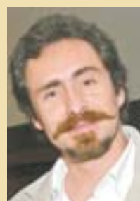
LOS BICHIR El PRD se los pelea