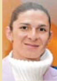
ANA GUEVARA La busca el PRD...