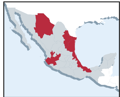
Áreas en detalle